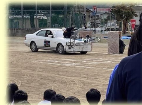
【世代に応じた交通安全教室】 (市内中学校)