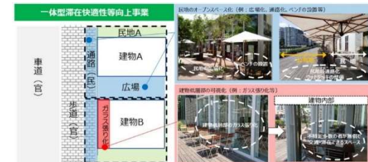
一体型滞在快適性等向上事業適用イメージ