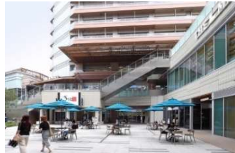
広場(公開空地)のイメージ