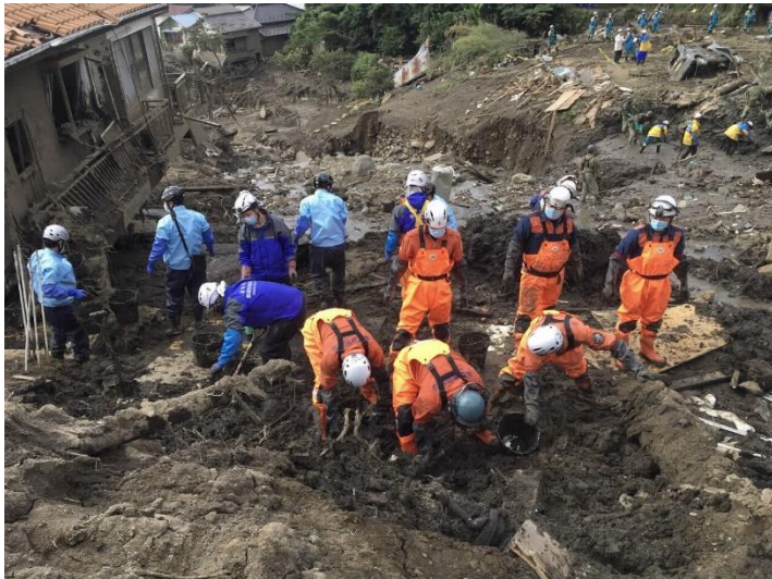
長野市隊の活動状況