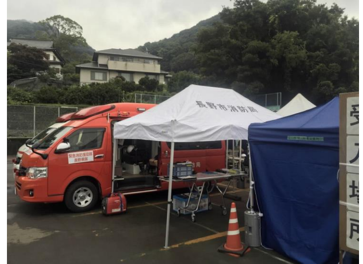
長野県隊現場指揮本部