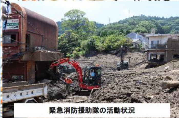
緊急消防援助隊の活動状況