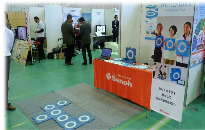
デンマーク発祥の健康増進器具 モトタイル