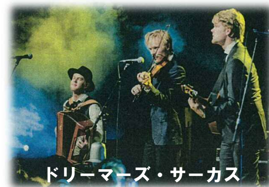
ドリーマーズ・サーカス

ヴァイオリン、ブズーキ、アコーディオンの若き天才イケメン3人組 デビュー当初から音楽賞を総なめにし、デンマーク王室より「ライジング・スター賞」も受賞