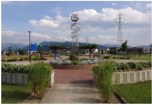
フラワーガーデン