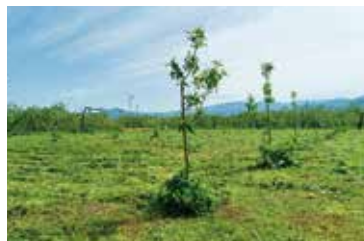
新たに植樹したりんご(グラニースミス)の苗木

現在18名の組合員がいて、高齢化などで続けられなくなった先輩方の畑を皆で管理し、りんごの産地を維持していく活動を行っています。共同で管理している畑の面積は、約2ha。メンバー各自の畑と繁忙期を分散させるために、収穫時期が早い夏あかり、紅玉、秋映、スリムレッド、グラニースミスの5品種を栽培しています。2019年の被災直後は、大勢の農業ボランティアさんに泥出し作業などを行っていただき、被災翌年の2020年からりんごの栽培ができるようになり、大変感謝しています。被災によって離農した方の畑を引き継いだり、更地にしてしまった土地にりんごの苗木を植える活動にも取り組んでいます。苗木からりんごが