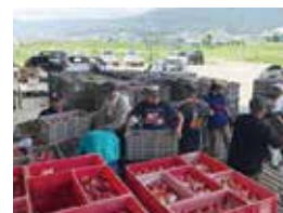
収穫したりんごを農協に搬入

ぽんど童の畑で収穫したりんごは、基本的に農協経由で市場に出荷していますが、被災により注目が高まったこともあり、「ぽんど童のりんご」ということで、私たちの活動を理解していただけるような場所に出荷できる体制が徐々にできてきました。そうやって、付加価値を付けることで単価もよく取引させていただき、活動がしやすくなったことはありがたいことです。