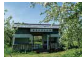
「ぽんど童」の名前は英語のpond(沼)と童(こども)から。「長沼っ子」の象徴としてりんご畑を守っていくという思いが込められている。

最大の課題は、農家の後継者問題です。今後、今いる人たちだけではカバーしきれない部分も出てくるので、ぽんど童が新規就農者を迎え入れる受け皿となり、私たちと一緒に地域を盛り上げてくれる人を増やせればと思います。そのためにも、いいりんごを毎年作り続けること。“被災地”という認識ではなく、“おいしいりんごの産地”として、長沼を盛り上げていきたいと思っています。