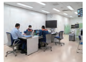
消防署職員が事務作業等を行う執務室

長野市東北部の防災力の強化を目指して、柳原分署と連携して水災害への対応強化に取り組んでいます。具体的には柳原分署に配置された津波風水害対策車に積載されている水陸両用バギーの操縦やボートの操船訓練を重ね、消火だけでなく、自然災害対応や救急救命活動も対応できる職員教育を行っています。豊野分署の管轄エリアは豊野支所と全く一緒ですので、地区内の情報共有など、素早い連携がメリットです。今後も消防団をはじめ地域と定期的に情報の共有や交換を行い、地域の防災力向上に努めていきます。