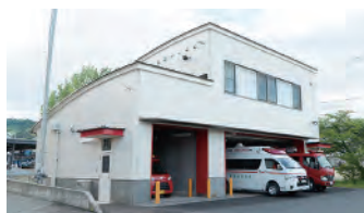
豊野支所の裏にある豊野分署の車庫と仮眠室。旧消防コミュニティセンターの建物を改装