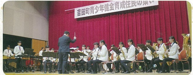
長野吉田高校 吹奏楽班

吉田町で活躍する生徒たちの発表 そして、その生徒たちの未来に向けて 大人たちからのメッセージ とても有意義な時間となりました。