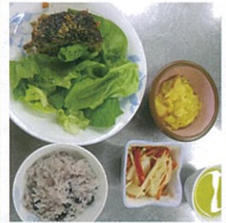
【献立】 和風ミートローフ りんごきんとん 黒豆ごはん 即席ピクルス