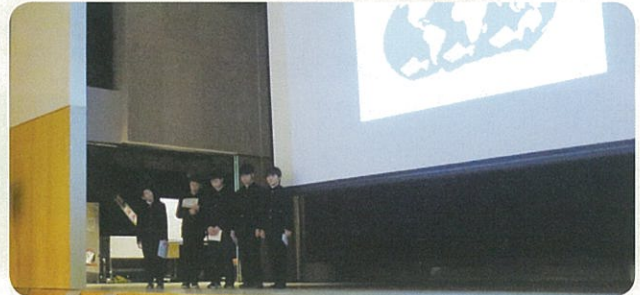
東部中学校 広報部

3年生が卒業して初めての劇で、練習中いざこざが あったり、なかなかまとまらなかったが、今までの 中で一番良い出来で良かったです。