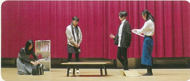
東部中学校 演劇部

コンクール明けで練習期間が短い中、上手いかな いことも多かったが、演出を入れるなどお客さんに 楽しんでもらえるよう、皆で考えて出来たので良 かったです。