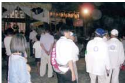
9 / 25 吉田神社祭礼パトロール