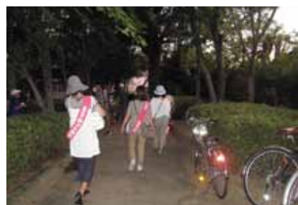
7 / 21 たつみ祭りパトロール

お祭りには、いくつになっても心弾むもの。子ども達も解放的になりがちです。家庭で外で、大人の愛の声かけひとつ：どうか安全に、子どもとしてのルールを守って、無事に帰宅してほしい：そう願って回ります。青少年委員会は、防犯協会さんとの合同パトロールで今後も子ども達を見守ります。帰宅時間、外見の変化所持品、お金の使い方など、子ども達に変化はありませんか？様子をみて気がかりなことは早めに周囲に相談しましょう。