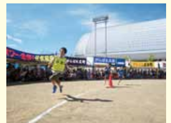
少年少女混合リレー