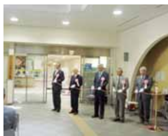
H25.10.1 開所式 （ノルテナがの1F）