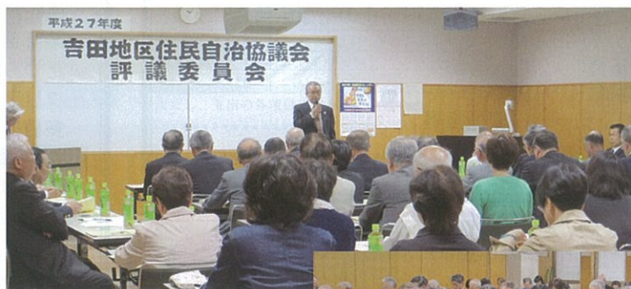
平成27年5月9日(土) 吉田公民館にて