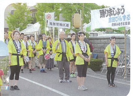
鬼無里連のみなさん