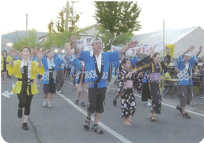
地区連のみなさん

7月25日(土)、一つの節目となる吉田ふるさと夏まつりの踊りには、地域間の交流として、鬼無里地区の皆さんも参加されて盛大に出来ました。参加連は地区・企業で20連、中学生(東部中学全クラス)22連の42連で、大人1202名、子ども1572名の2574名の大勢が参加し「みて楽しく、踊って楽しく」をスローガンに、暑さを吹き飛ばして踊りました。「何丸連」にも大勢の皆さんが、何丸の法被を着て踊って、踊りを盛り上げて下さいました。