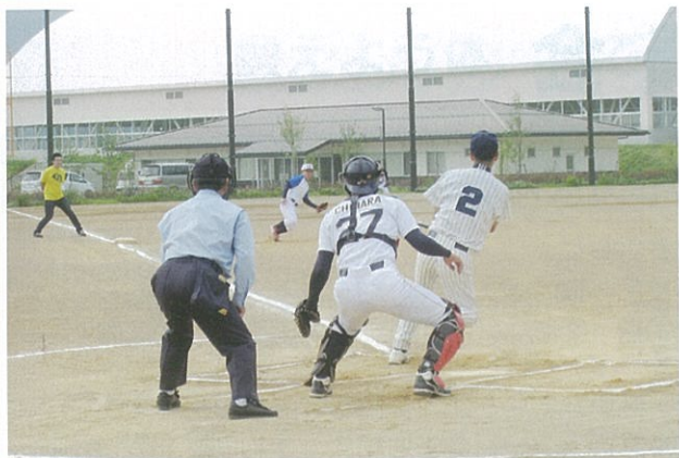
野球会場の熱戦 (北部スポーツ・レクリエーションパーク)

五月三十一日(日)、野球は、11チームが参加し、運動公園県営野球場と三才にある「北部・スポーツ・レクリエーションパーク」の野球場で行いました。ソフトバレーボールは、12チームが参加し、今年の会場は、朝陽社会体育館で行いました。 今年も、成人野球とソフトバレーボールとも、接戦の試合が多く、選手と応援が一体となって盛り上がった一日となりました。