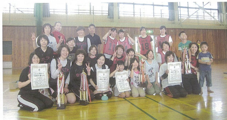
ソフトバレーボール大会で表彰された皆さん (朝陽社会体育館)