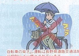
自転車の傘さし運転は長野県道路交通法施行細則により禁止されています。

！自転車のルール違反を伴う交通事故が多く発生しています。自転車も車両です。責任を自覚してルールを守り安全利用に努めましょう。