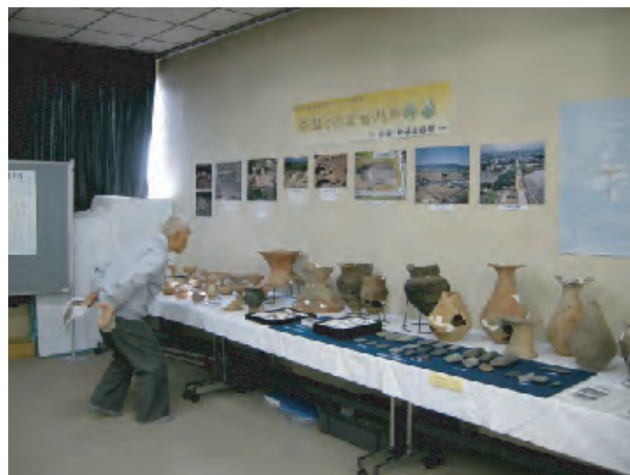
柳原公民館での出張展示（平成20年度）