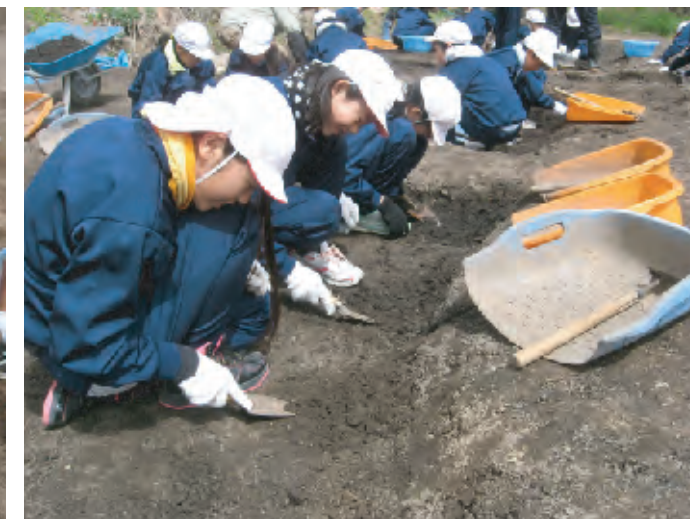
古里小学校6年生による発掘体験（平成22年度）

発掘調査をおこなっている遺跡において、発掘調査の目的や方法を学びながら実際の作業を体験していただきます。実際に土器や石器などを見つけることができ、土に埋もれた生の歴史に触れることができます。