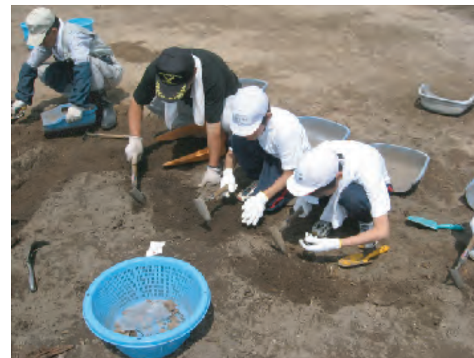
若槻小学校6年生による発掘体験（平成21年度）