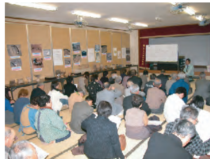
檀田地区の発掘調査について（平成16年度）