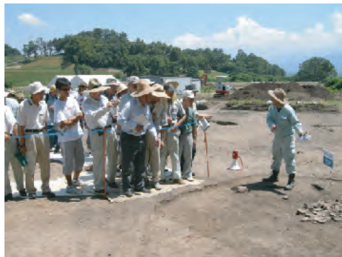
古里地区籠沢遺跡の現地説明会（平成21年度）