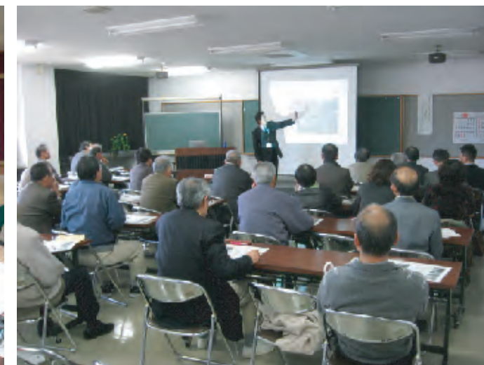
善光寺周辺の発掘調査について（平成20年度）

講座や勉強会へ職員を派遣し、発掘調査からわかる地域の歴史について、出土した資料や写真などを踏まえながらわかりやすく解説します。また、勾玉づくりや土器づくりなどの体験教室も実施できます。