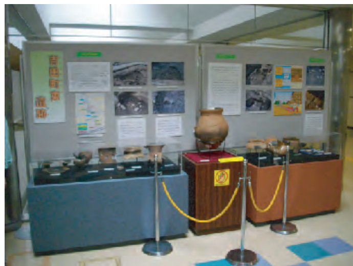
吉田公民館での出張展示（平成22年度）

発掘調査で出土した土器や石器などを、公民館や学校のスペースをお借りして展示・解説いたします。展示期間は1日からでもご対応できますので行事やイベントなどの開催にあわせてご活用ください。