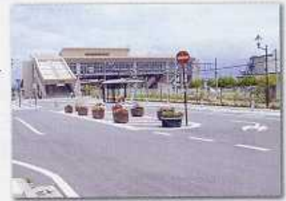
豊野駅北口ロータリー