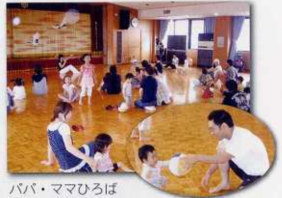
パパ・ママひろば