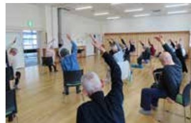
◀かがやきひろば篠ノ井 男性のいきいき体操

市では、健康づくりやレクリエーション、介護予防などの講座を開催しています。近年、コロナ禍で家にこもり、フレイル(虚弱)になる人が増えています。講座に参加することは頭・体・心に良い刺激を与え、フレイルを予防する効果があります。この春から新しいことを始めてみませんか。