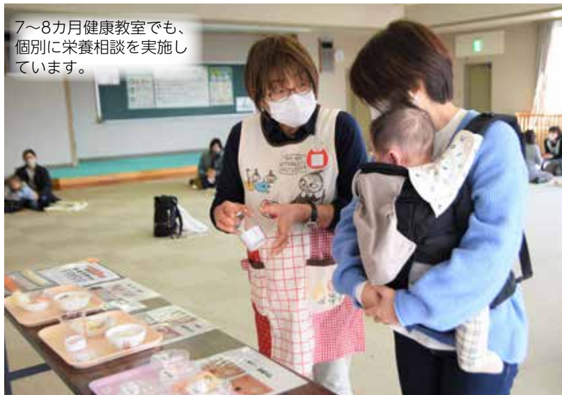
7～8カ月健康教室でも、個別に栄養相談を実施しています。