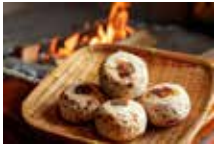
▲やきもち家の灰焼きおやき

中条にある「信州むしくらの湯やきもち家」の温泉や灰焼きおやき、「道の駅中条」で出会える郷土食や特産品の情報などを紹介します。