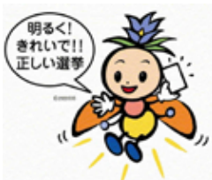
▲長野県選挙啓発マスコットキャラクター「ほたりちゃん」