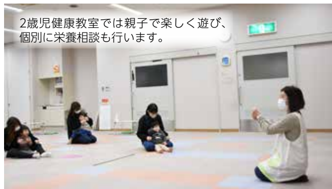
2歳児健康教室では親子で楽しく遊び、個別に栄養相談も行います。