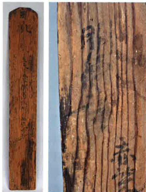
正面・部分 「明德寺」