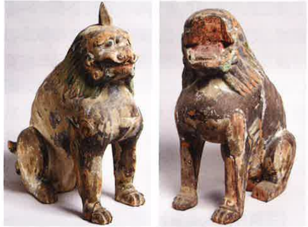
吽形・阿形

阿形の頭頂部に柄穴があることから、本来は阿吽ともに角のある狛犬一対像であったことが分かります。近年の調査で初めて古像であることが判明しました。玉依比売命神社は延喜式神名帳に記載される古社として知られます。当社の神官小河原供秀が皆神山に入って社家から修験に転じ、皆神修験の祖となったとされます。