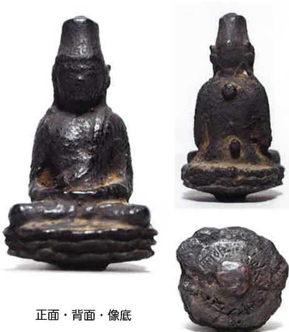
正面・背面・像底

かつて皆神山内にあった万行寺に伝わった総高8.3cmの小仏。台座底面に、仏像では市内最古の紀年銘が陰刻されます。万行寺は皆神山和合院の同行（末寺）で、開院（初代）は宥良坊（永禄3年・1560没）です。