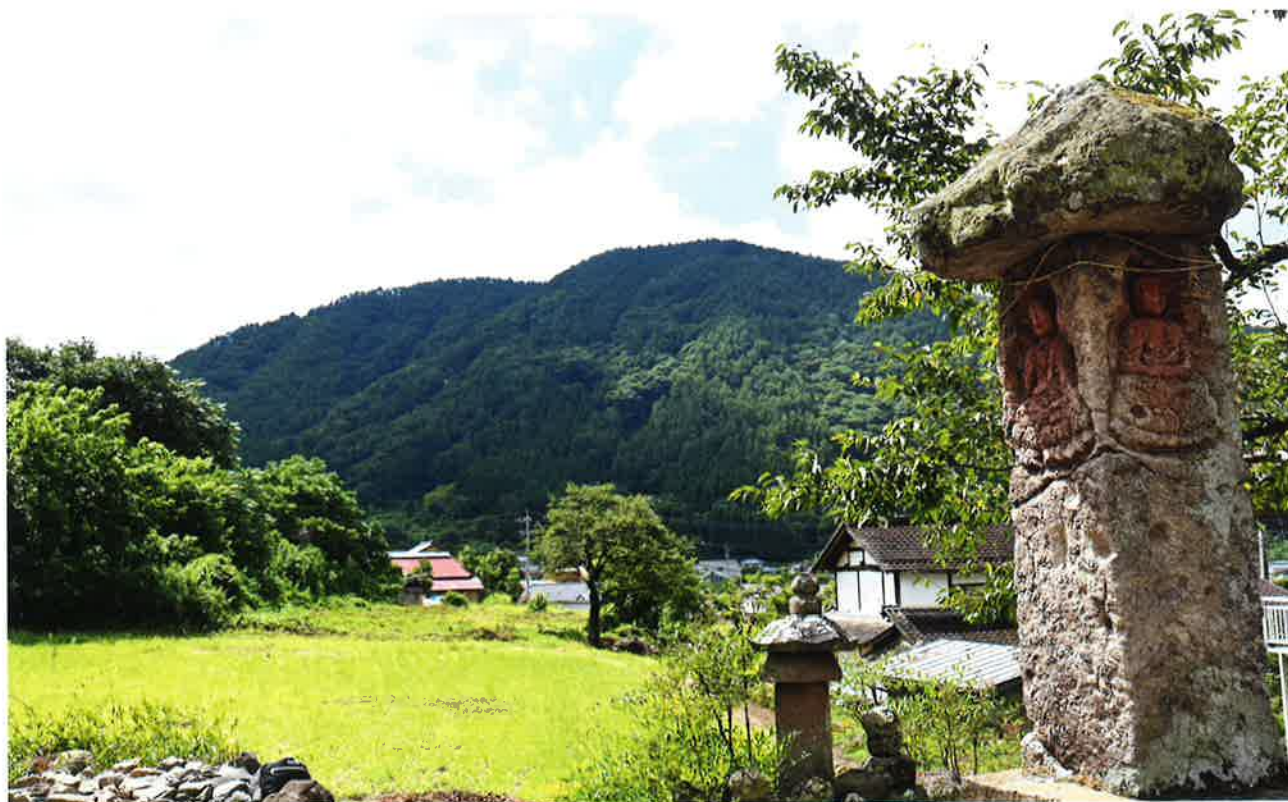
清滝寺参道に立つ鎌倉時代の石幢（笠仏）と皆神山

この展示では、皆神山を中心とした長野市松代町南東部の地域に伝わる、これまで知られていなかった古代・中世の名宝を一堂に紹介しています。この地域の歴史の奥深さに触れていただければと思います。（原田和彦）