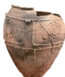
いろいろな 모양が 付いているよ