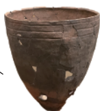
火ですすけて 黒くなっているよ

・縄文時代の人がつくった「土器」という 道具です。この形の土器は、食べものを 煮るためにつかわれました。