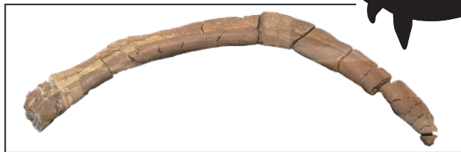
生きていたころは こんなシルエット