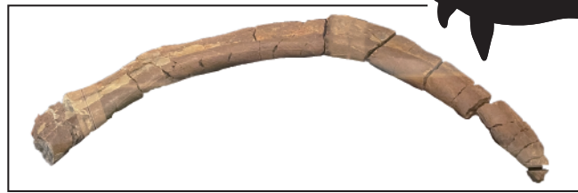
（ クジラの肋骨 ）