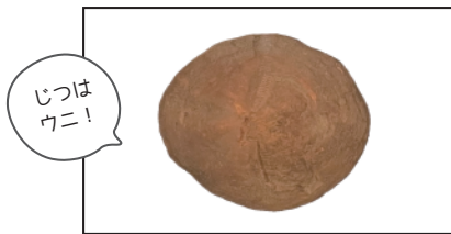
（ ムカシブンブク ）

すがた 長野は50万年前は海だったので、海の生きものの化石が発掘されます。 これは何の化石でしょう？