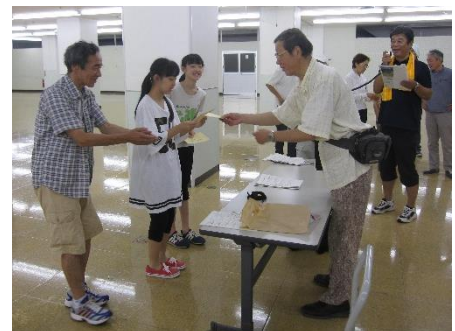
表彰式の様子です