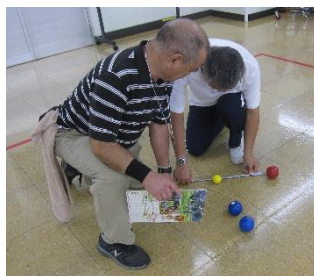
目測判定が不能な接戦はメジャーの出番です。