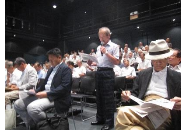
質問に立つ 南県町 林区長