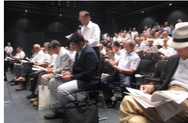
質問に立つ 妻科 宮崎区長