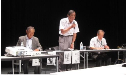
第四地区 最上会長が 議題提案しました

第一から第五地区では長野市芸術館において、長野市長と意見交換する「活き生きみんなでトーク」を開催しました。第四地区からは中心市街地に住む人を増やす取り組みを長野市に提案しました。