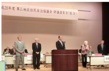
退任される役員の挨拶