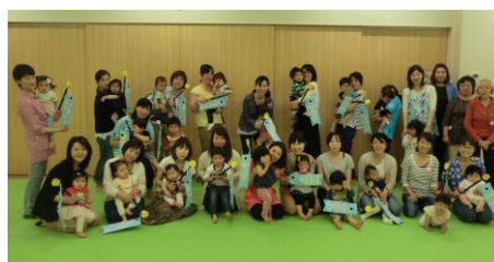
5/19 子育てサロンで みんなで楽しくこいのぼりづくり

毎月第2(木)に実施している「サンサンひろば」に参加のお子様の見守りをお手伝いして下さるボランティアの方を募集しています。お気軽にお問合わせ、お申し込み下さい。