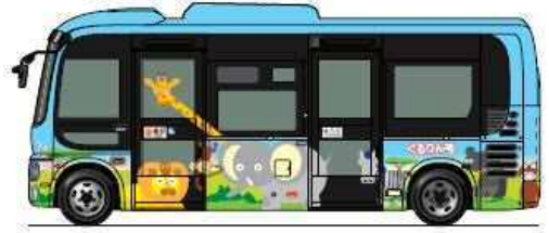
34人乗り(座席12、立席21、乗務員1)でノンステップ、車イス用スロープ完備。