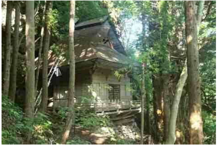
写真2 (2016. 8. 4) 西側 外観