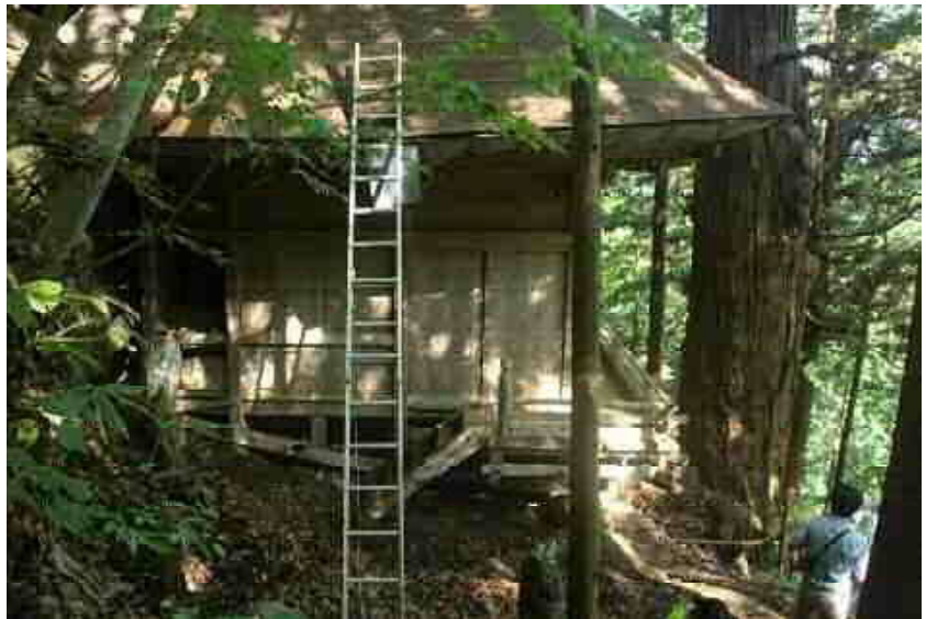
写真3 (2016. 8. 4) 戸隠田頭の巖窟観音堂 南側 外観