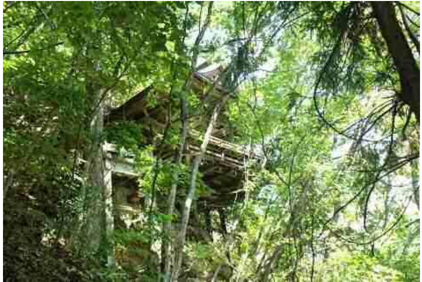
写真3 (2016. 7. 10) 南西側 下から 外観