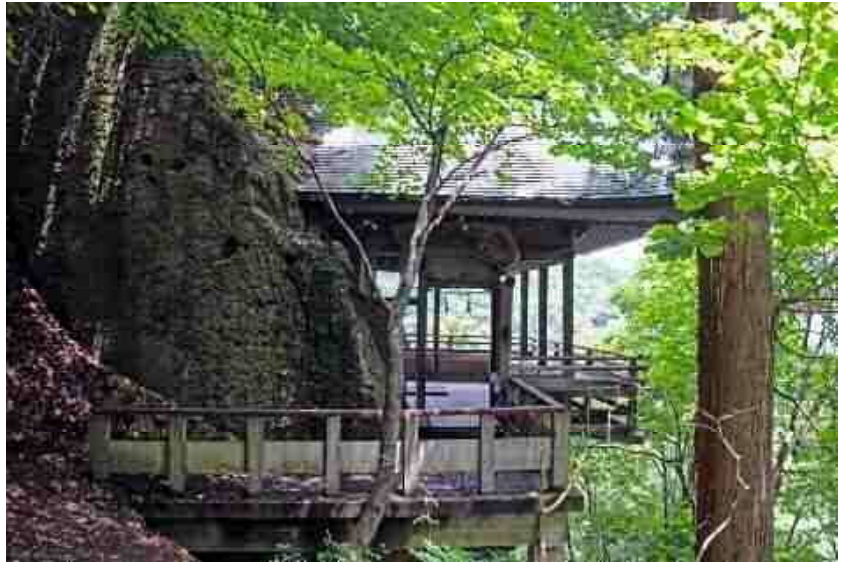
写真2 (2016.8.31) 南西側 外観