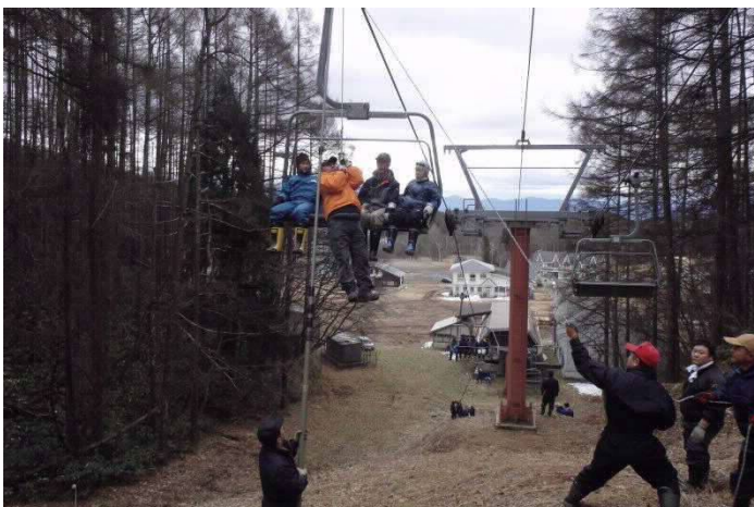
飯綱高原スキー場