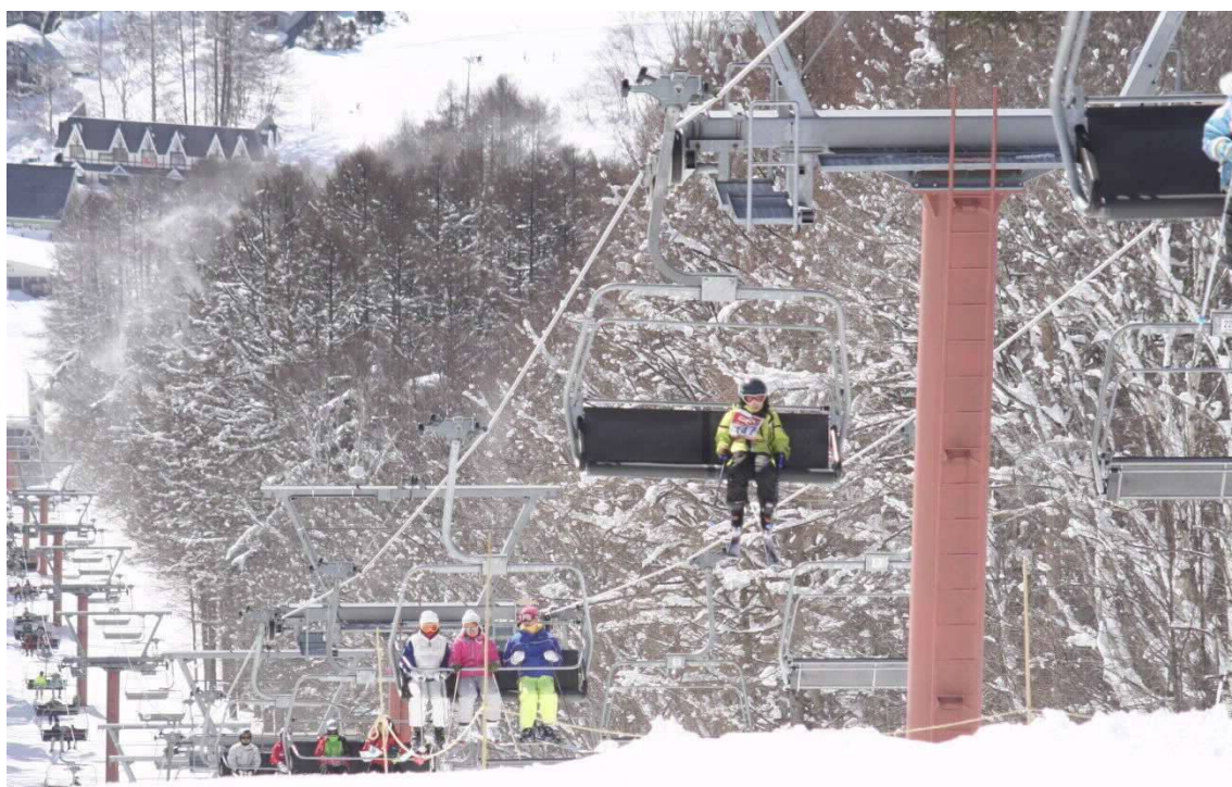
飯綱高原スキー場 第1クワッドリフト