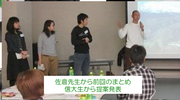
佐倉先生から前回のまとめ 信大生から提案発表