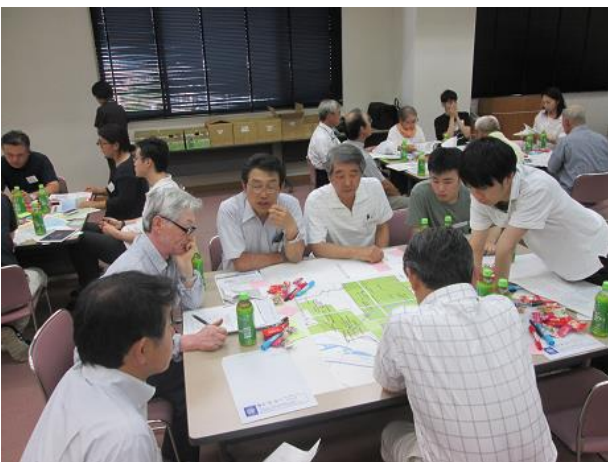
↑グループ討議の様子

公共施設マネジメントについてのおさらいに続いて、信州大学工学部羽藤研究室の学生から、「第1回ワークショップのまとめと提案」発表がありました。それを参考に、検討対象施設を絞り込み、その施設で行いたい活動を考えました。活発なグループ討議をいただいた皆さま、ありがとうございました。