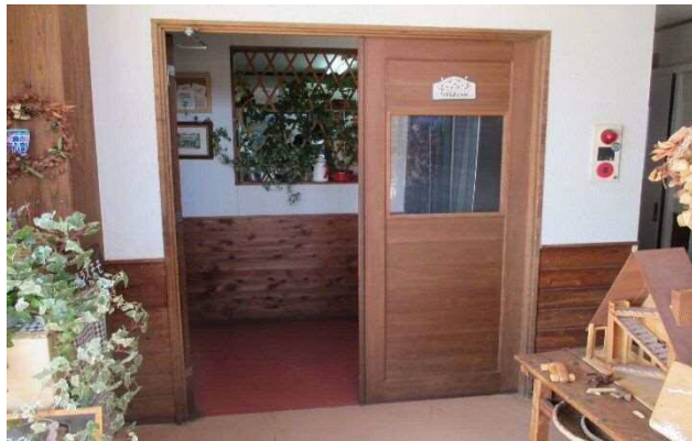
1階キャンパスルーム入口