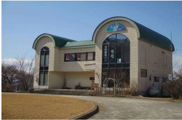
キャンパスハウス全景