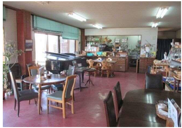
1階キャンパスルーム