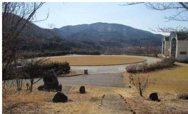
アルプス展望公園