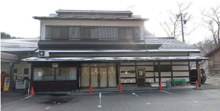
旧活性化センター