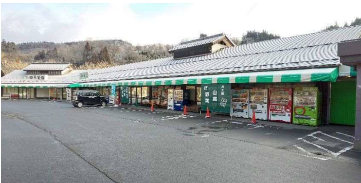
地場産業振興市場