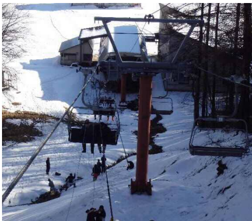
飯綱高原スキー場 救助訓練