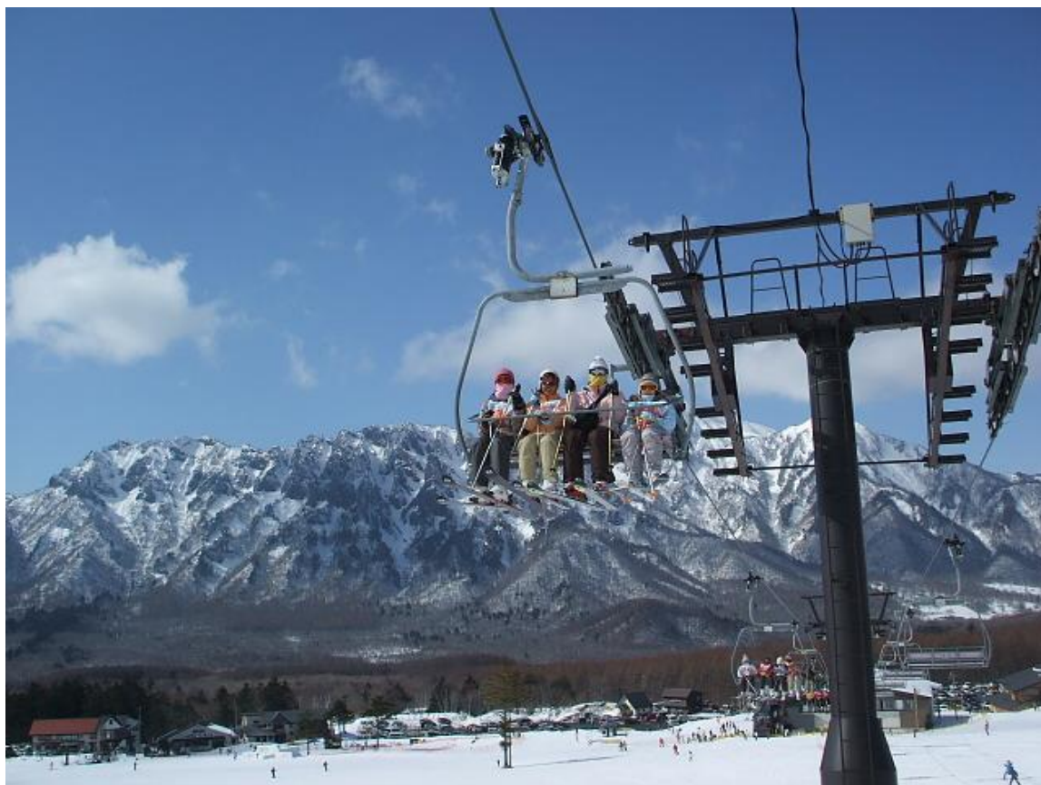
戸隠スキー場第3クワッドリフト