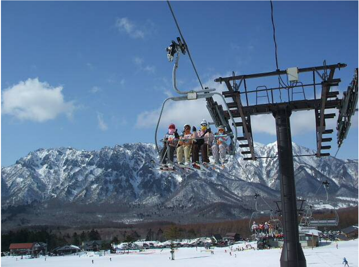
戸隠スキー場第3クワッドリフト