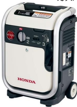
▼HONDA インバーター発電機 ガスパワー enepo