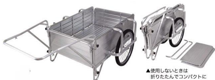
▲折り畳み式 アルミ製リヤカー

消防署からの要請もあり、自主防災連絡協議会(第二地区の自主防災会の集合体)を設立しました。住自協の環境安全部会、各町の自主防災会(防災指導員等)、防災士が一体となって防災訓練等を行います。