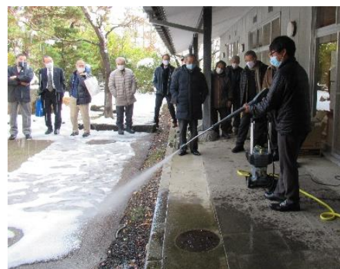
▲業務用冷水高圧洗浄機 実演風景