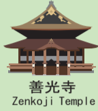
善光寺 Zenkoji Temple