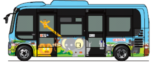
34人乗り(座席12、立席21、乗務員1)でノンステップ、車イス用スロープ完備。