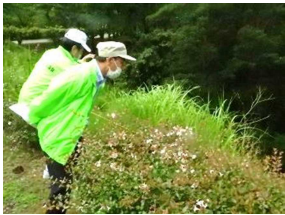
パトロールする2人

浅川地区住自協内の「ゴマシジミ保護・育成チーム」は長野市霊園に生息する希少なチョウ「ゴマシジミ」の密猟を防ぐ為、8月に入り早朝パトロールを行っています。8月19日(木)の早朝パトロール活動をINCが取材しました。