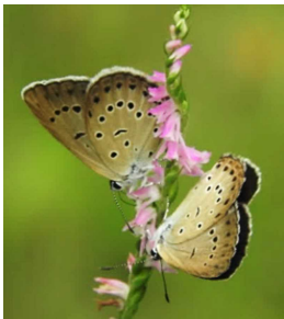
吸蜜するゴマシジミ

環境省のレッドデータリストで「絶滅危惧種1A類」に指定されている希少なチョウ「ゴマシジミ」が7月28日2匹が園内で舞い始めているのを、ゴマシジミの保護育成チームが確認しました。