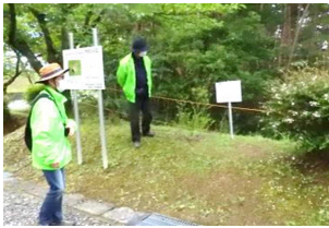
霊園の早朝パトロール

環境省絶滅危惧種に指定されている希少なチョウ「ゴマシジミ」が生息する長野市霊園で密猟を防ぐため、浅川地区住民自治協議会では10人が保護・育成チームを作り、8月16日から9月5日まで霊園で早朝パトロールを行い延べ30人が参加しました。