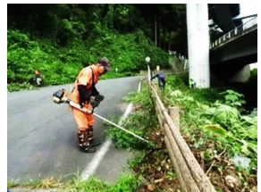
表参道入口南道路草刈り

朝7時「浅川ダム・フジバカマ苑」東斜面に集まった会員7人は草刈り機で斜面に背丈ほどに伸びた草と格闘して草刈りを行いました。3人は八楯神社参道入り口～ループ橋間の道路脇に伸びた木や草、岩側の垂れ下がった雑草を刈り付近は綺麗になりました。