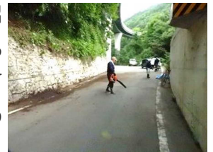
綺麗になった道路

朝7時集まった会員は、2m以上に伸びて道路にはみ出して伸びる雑草、道路脇の欄干に絡みつき道路に伸びる雑草、道路壁面に伸びるツル・ツタを刈払機や鎌で刈っていきます。また道路脇に積もった落ち葉や土を熊手・ほうきで掃き集め一輪車やシートに乗せて片付けました。