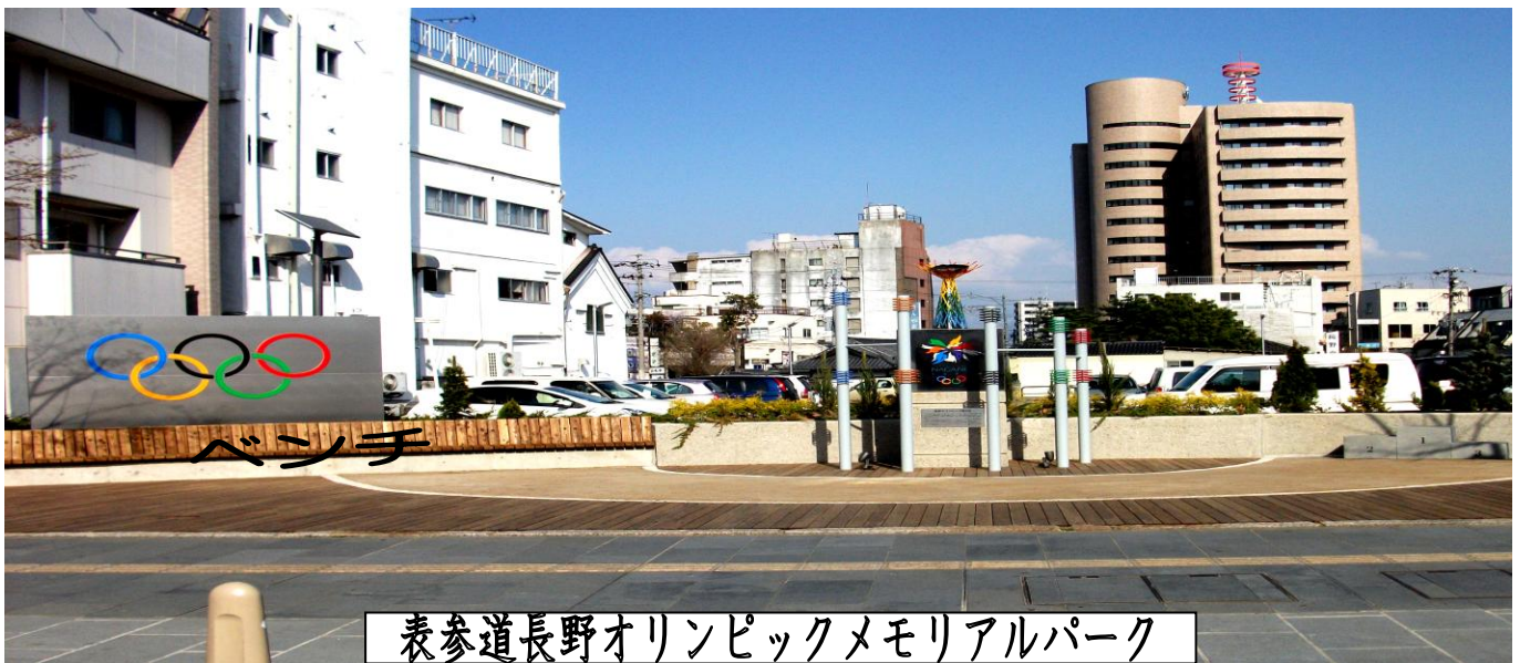
表参道長野オリンピックメモリアルパーク