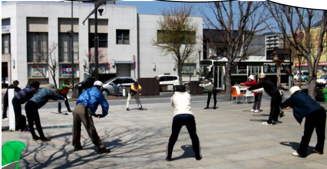
トイゴ前で準備体操