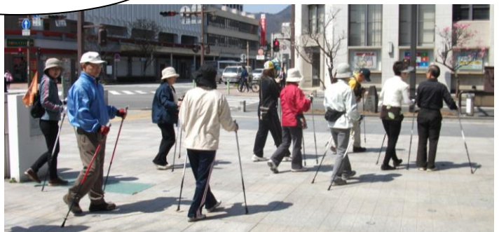
いよいよスタート

3月5日発行の「第18号協議会だより」でお知らせ致しましたノルディックウォーキング講習会の参加募集に、本日11名の参加で今年度始めました。毎月第3木曜日(10時集合)に開催致しますので、お気軽に参加し・楽しんでみませんか。 (用具は用意してあります。)