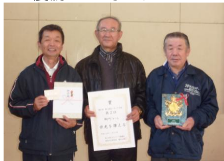
準優勝 柳町チーム