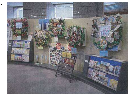
地域・季節情報展示イメージ