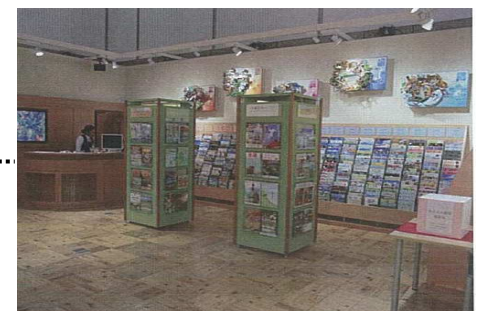
ポスター・パンフレット展示イメージ