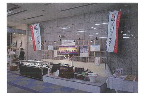
地域・季節情報展示イメージ