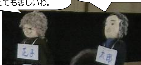
花子おばあさんと太郎おじいさん人形

【講師】キャラバン・メイト[専門研修修了者] (民生児童委員等市民ボランティア他)