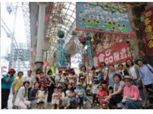
七夕飾りと理事長賞(右上)