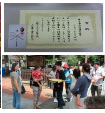
クッキープレゼントに大喜