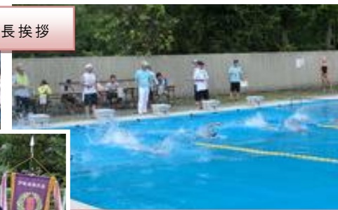
接戦を繰り広げた町対抗リレー