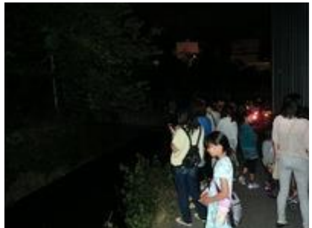
200名もの参加者で賑わう観賞会