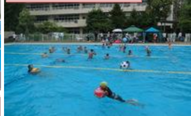
ビーチボールで自由遊泳