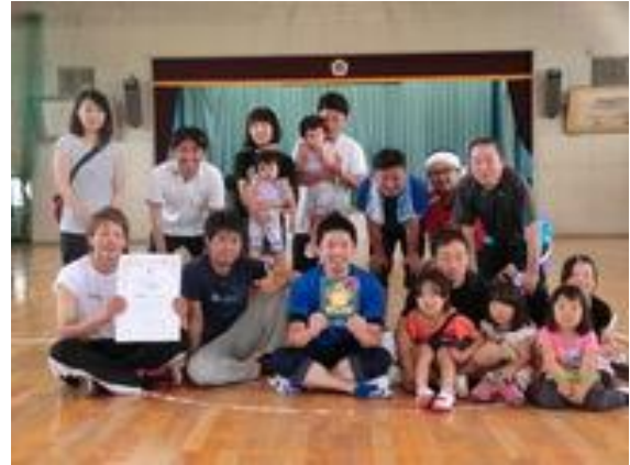
準優勝の西鶴賀町Aチームと応援団