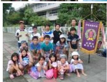
左:優勝した西鶴賀チーム