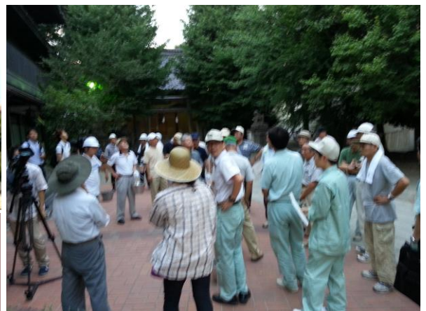
右→：集合した環境美化部員や町の方達、市職員