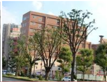
上↑：剪定を終えたケヤキ