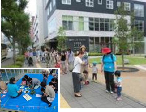
左下:七夕飾り作成中 上:散歩に出発

7月30日(木) 15組31人の親子が集まっていつもの会場前に集合。自分達で作った七夕飾りのある権堂アーケード街へ見学スタートです。7月28日に優秀作品の表彰式があって、サンサンひろばの作品は、初めての出展にも関わらず「権堂商店街理事長賞」を頂きました。午前10時30分権堂イーストプラザを出発して、作品が飾られている場所までお散歩です。今回もボランティアの方々からクッキーの差し入れがありました。