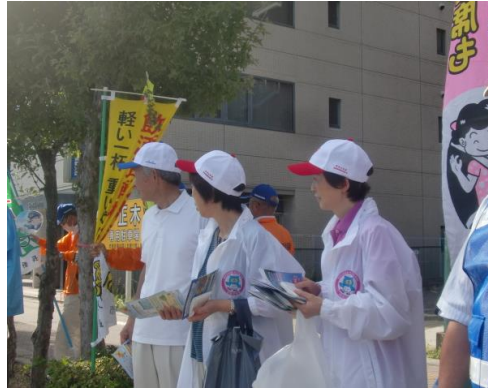
街頭に立って啓発ビラ配り