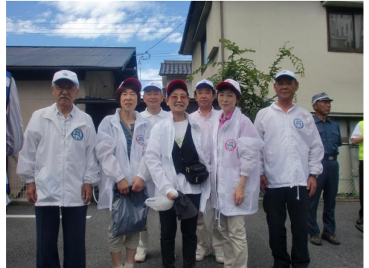
参加した防犯部の方達