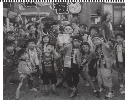
飯縄神社秋季大祭宵祭り