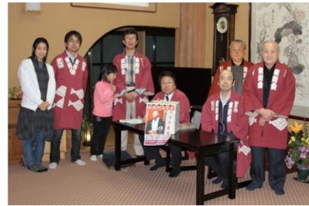
商店会のスタッフ