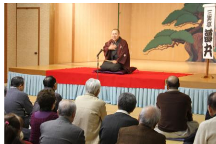
長野門前寄席の様子