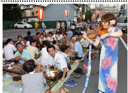
大勢の人で賑わう「のみの市」

生ビール、焼き鳥、おでん、焼きそば、もろこし等の販売や、バザー、育成会の協力による子供イベント、その他の催し物が盛大に行われます。