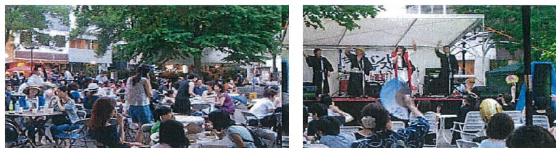
サマーフェスティバルの賑わい