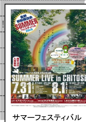
サマーフェスティバル

通りは歩天の夜店びんずる開催。B 級グルメ・地ビール・金魚すくい・ふわふわ象さん