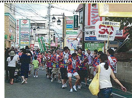
“あさひ・ふるさと夏祭り”

夏祭り「あさひ・ふるさと夏祭り」と名した祭りも、平成27年には第30回となり年々盛り上がりを見せしてきました。毎年7月の第4土曜日に開催（午後4時から9時までは歩行者天国となる）びんずる踊り〔審査・賞あり〕・各バンド演奏・みかさ幼稚園鼓笛隊・古里小学校マーチングバンド・長野市消防団音楽隊・夜市市など盛り沢山の催しがある。